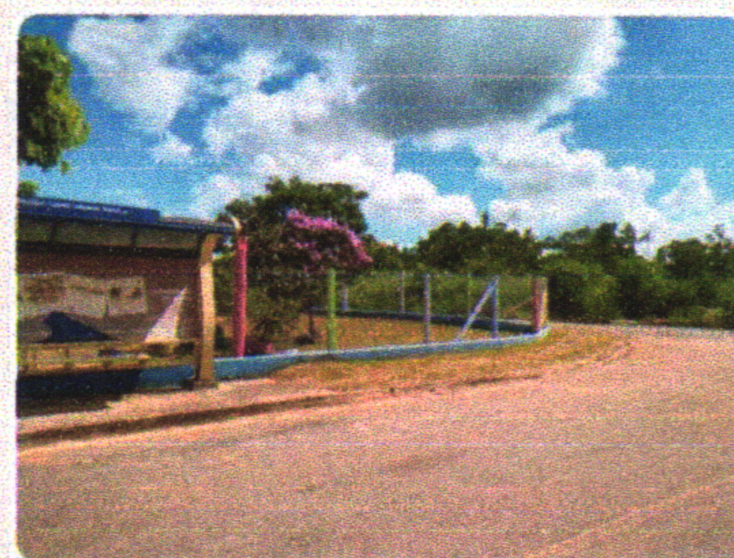
Poderia ser lá no cantinho com a porta pra rua