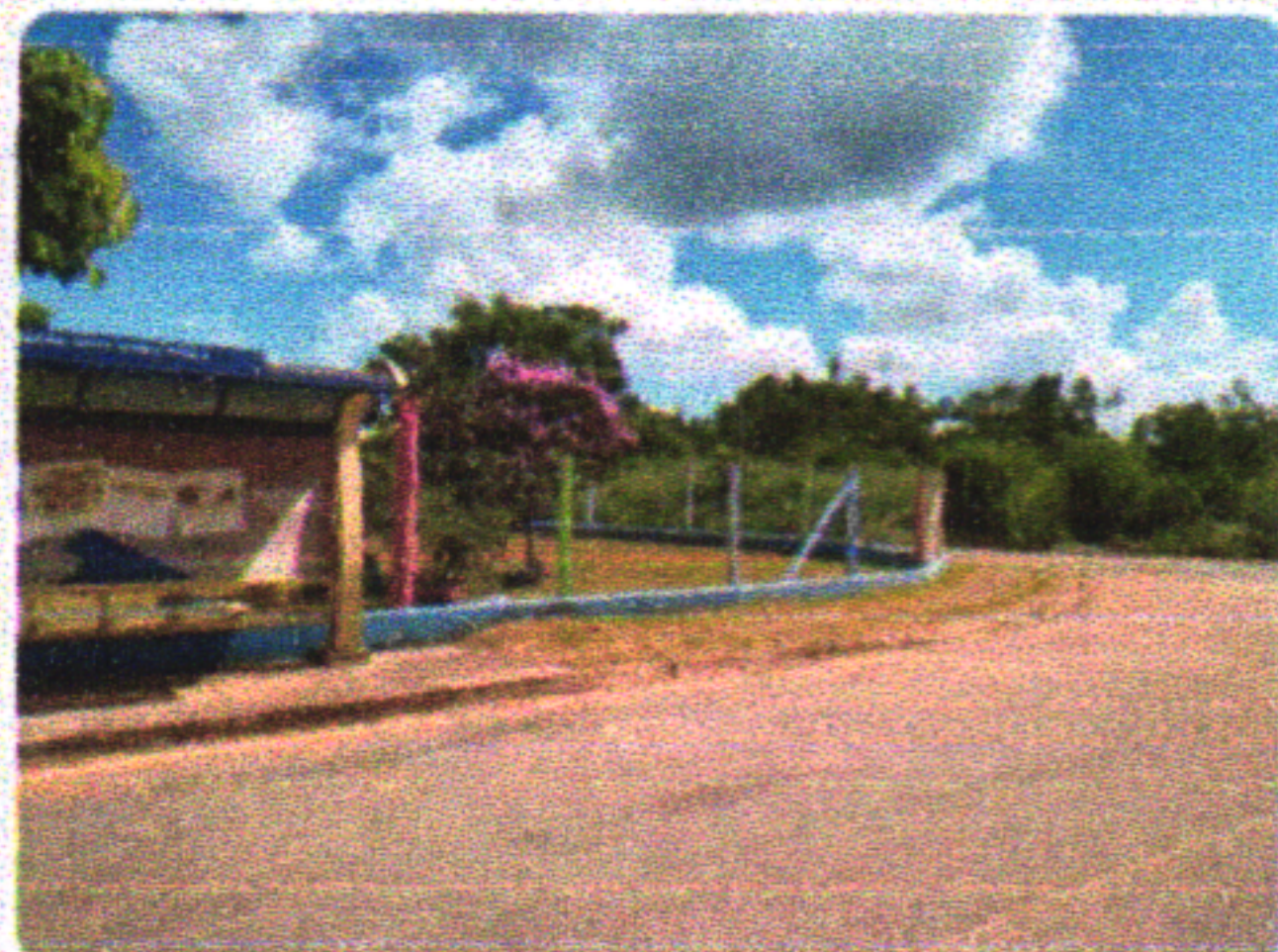
Poderia ser lá no cantinho com a porta pra rua